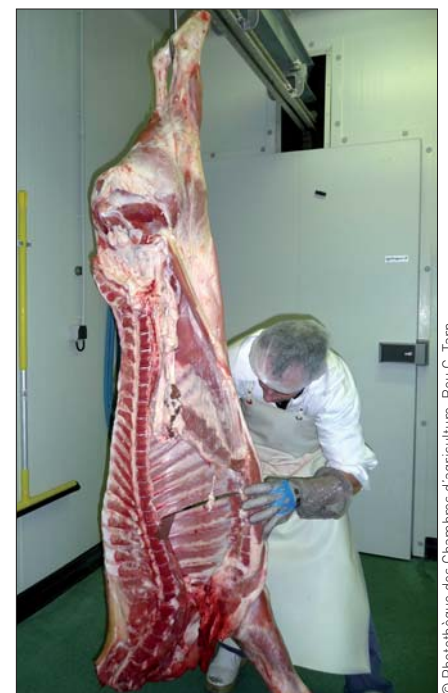
Découpe de viande au cours d'une formation destinée à des éleveurs

La disparition des outils municipaux et la centralisation des entreprises privées ont donc un impact très important sur la rentabilité et la pérennité des filières courtes. Il serait certainement nécessaire de retrouver une certaine cohérence dans la